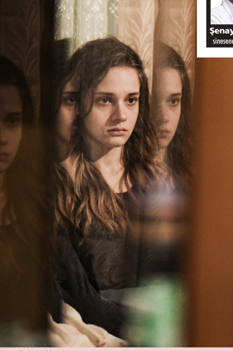
Hayat filminden bir sahne